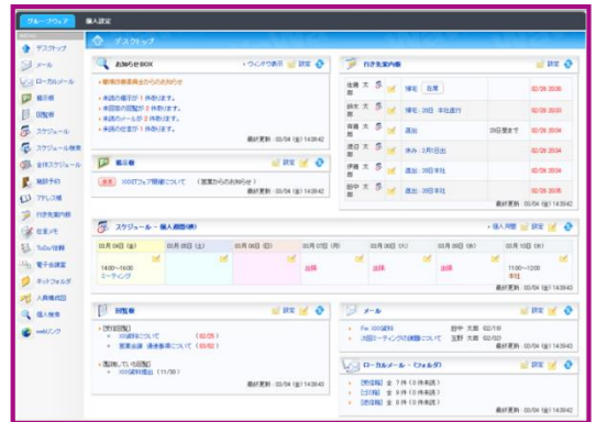
【デスクトップのイメージです。】

自社製品であり、運用するデータセンターから問い合わせ窓口まで、当社で提供しています。開発元と運用先が異なるサービスは数多くありますが、すべてのリソースを持つ当社だからこそ可能なワンストップサービスを提供します。